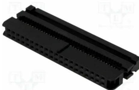
Фигура 2: IDC-40F

Нужно учитывать что распиновка (DIP-40 на шлейф) такого разъема отличается от общепринятых и следует придерживаться приведенному в разделе 4 описанию.